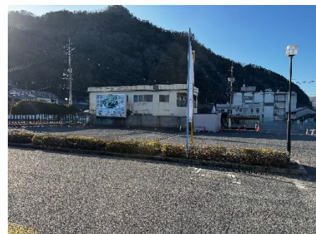
中央公民館(美作市民センター) 美作市立中央図書館 駐車場

なお、敷地内駐車場は中央公民館(美作市民センター)・美作市立中央図書館の共有となります。ご利用の皆さまにはご不便をおかけいたしますが、ご理解とご協力のほど、よろしくお願いいたします。