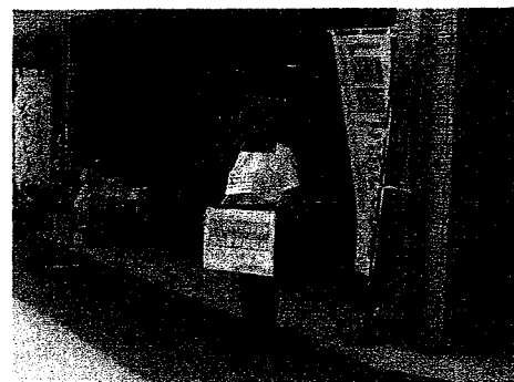
令和2年7月豪雨災害の街頭募金活動に参加しました

※令和元年度の一般会計約218億円、特別会計約131億円の決算認定については10月6日の決算特別委員会で認定されました。