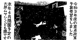
令和2年7月臨時会開催 緊急生活に参りました