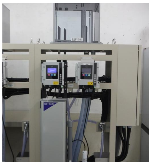
(高感度浄水濁度計)