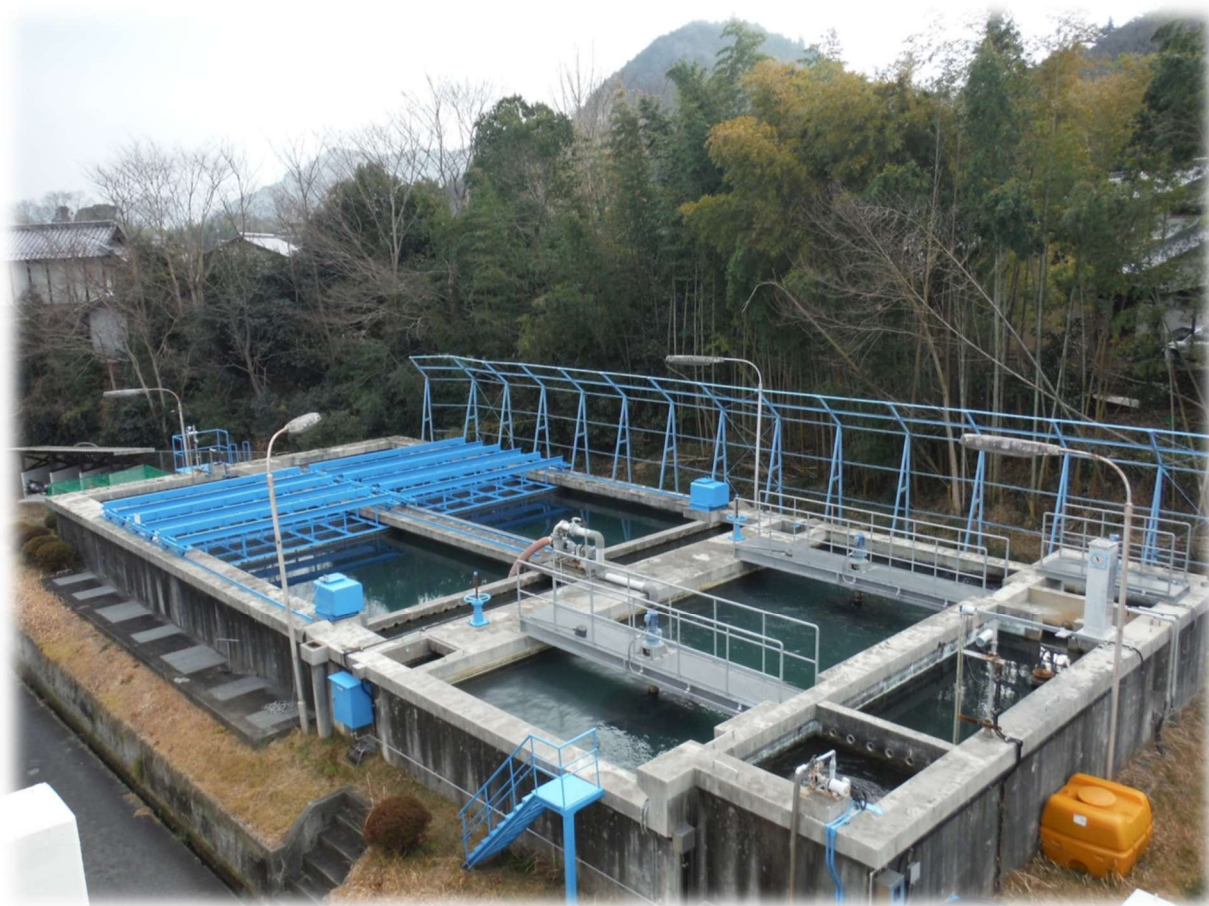
美作浄水場(沈澱地)