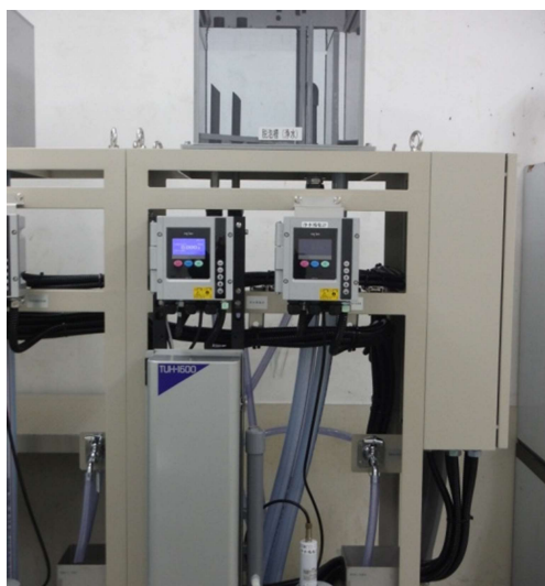
(高感度浄水濁度計)