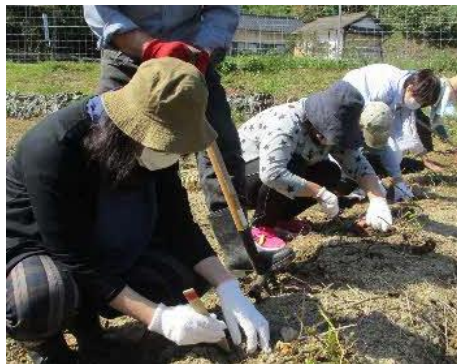
サツマイモ掘り体験