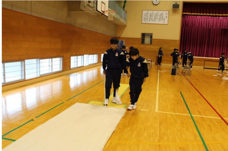
(中学生によるアイマスク体験)