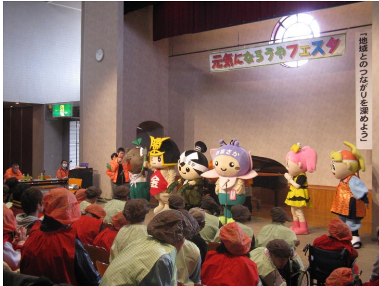
（啓発イベント『元気になるうやフェスタ』）

さらに、当事者の生きがいや仲間づくり、社会的理解を進めるために、障がい者団体、親の会が活性化し、活動が広がるように支援します。（障がい者団体、親の会のつながり）