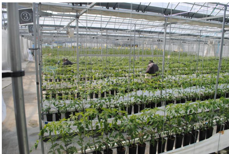
(就労継続支援 A 型事業所の農園)