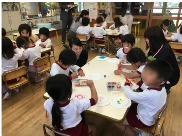
(保育園への巡回相談の様子)

(注 26) スクリーニング検査・・・「障がいや病気のある人」を早く発見し、早期の適切な対応につながるための検査のこと。