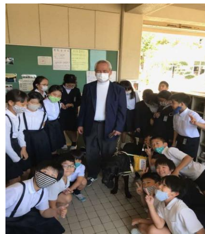
(小学生による全盲の方によるお話と、盲導犬体験)