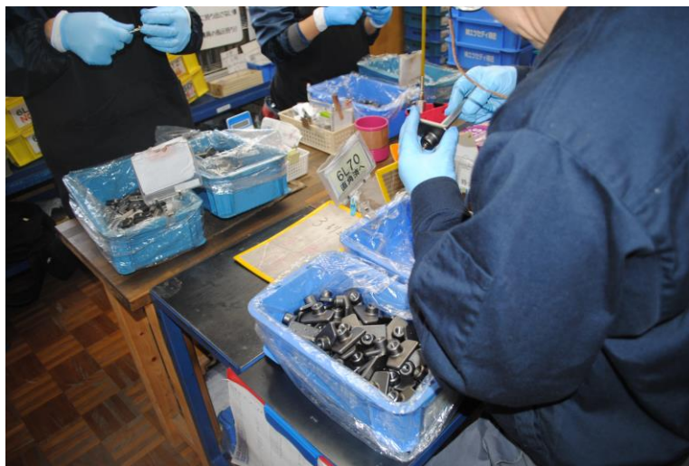
(就労継続支援 A 型事業所での作業の様子)