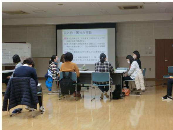
(ペアレントトレーニングの様子)